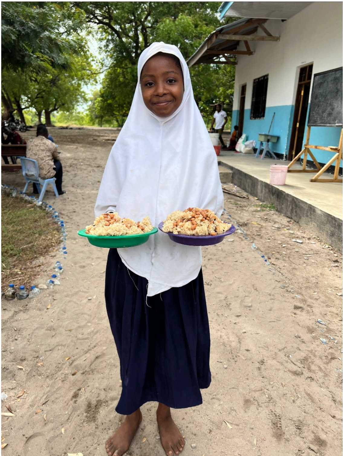
Maten är på väg till kompisarna