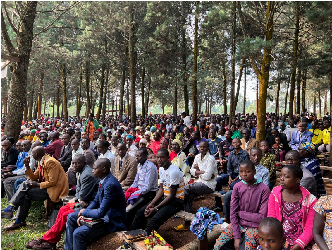
Delar av gudstjänstbesökarna på söndag förmiddag i Kirundo