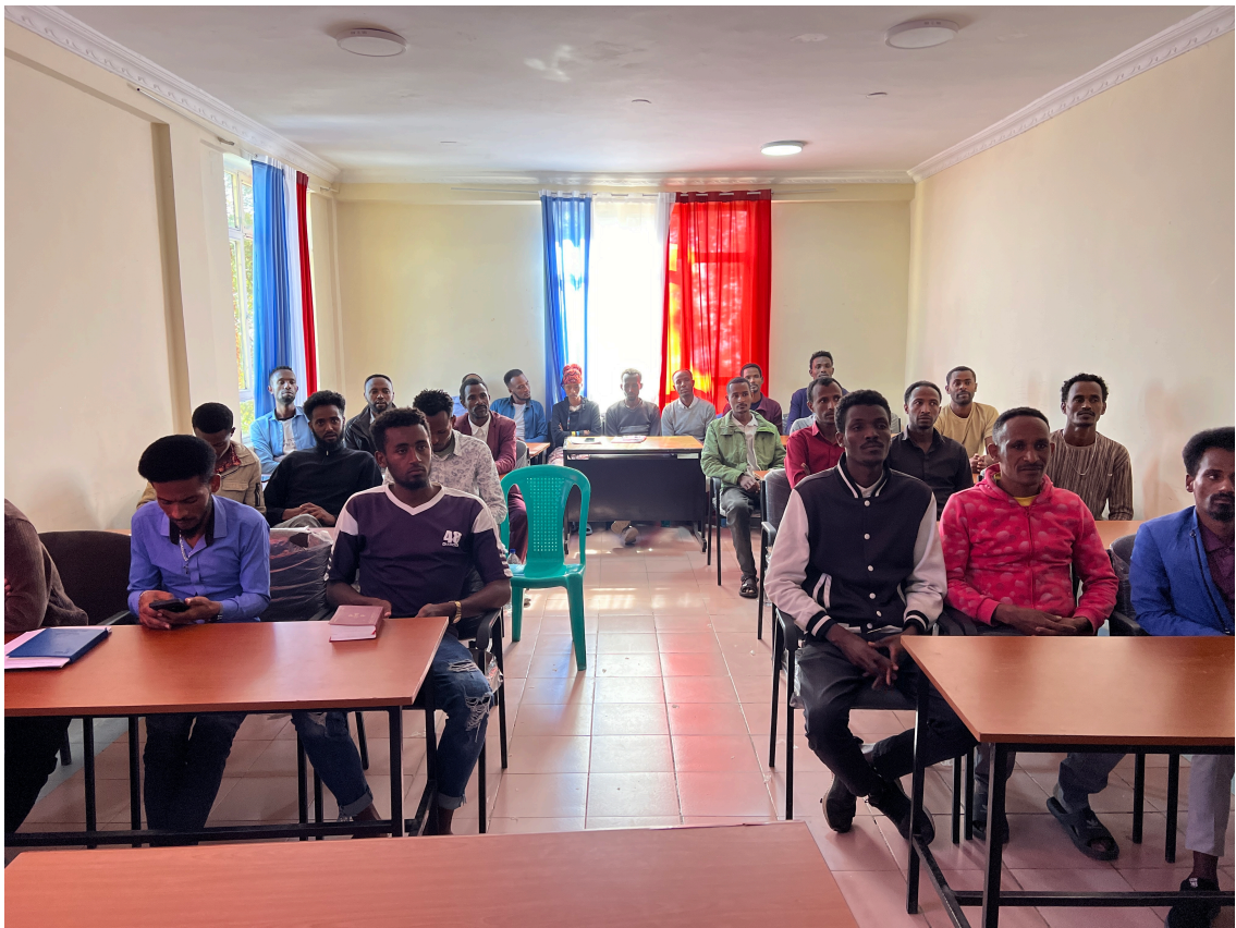
Missionärer från undervisning i Etiopien