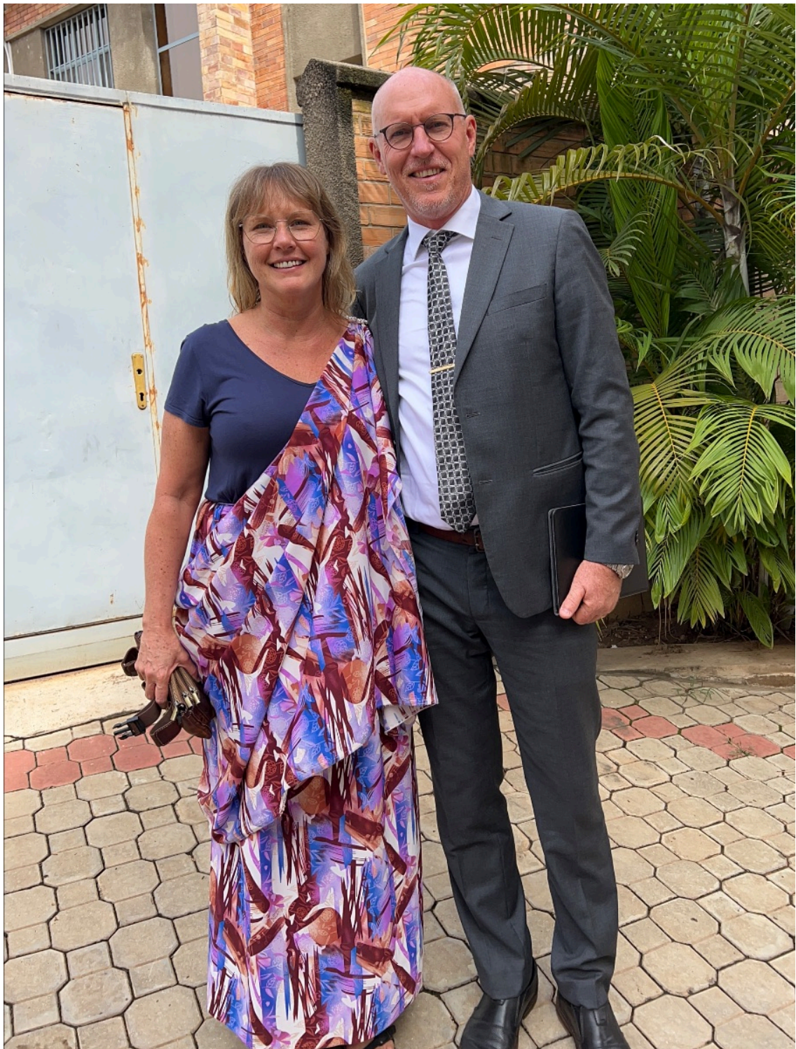
Våtvärma omslag i Burundi

Ja, det har varit en händelserik månad och då har vi också utlämnat mycket som vi skulle kunna skriva om.