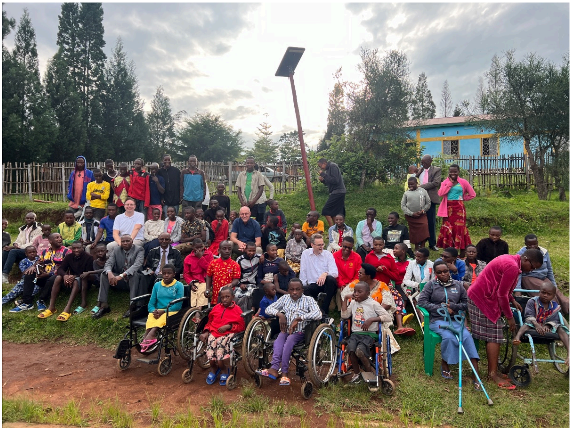
Bland vänner i Gakwende

Att gå runt på skolhemmet och möta barnen både värmer hjärtat men det känns också som om det går sönder gång på gång.