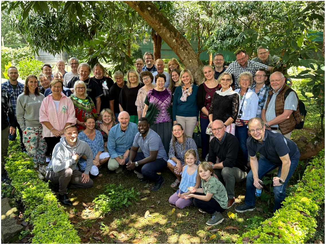
Nordiska missionärer samlade i Nairobi