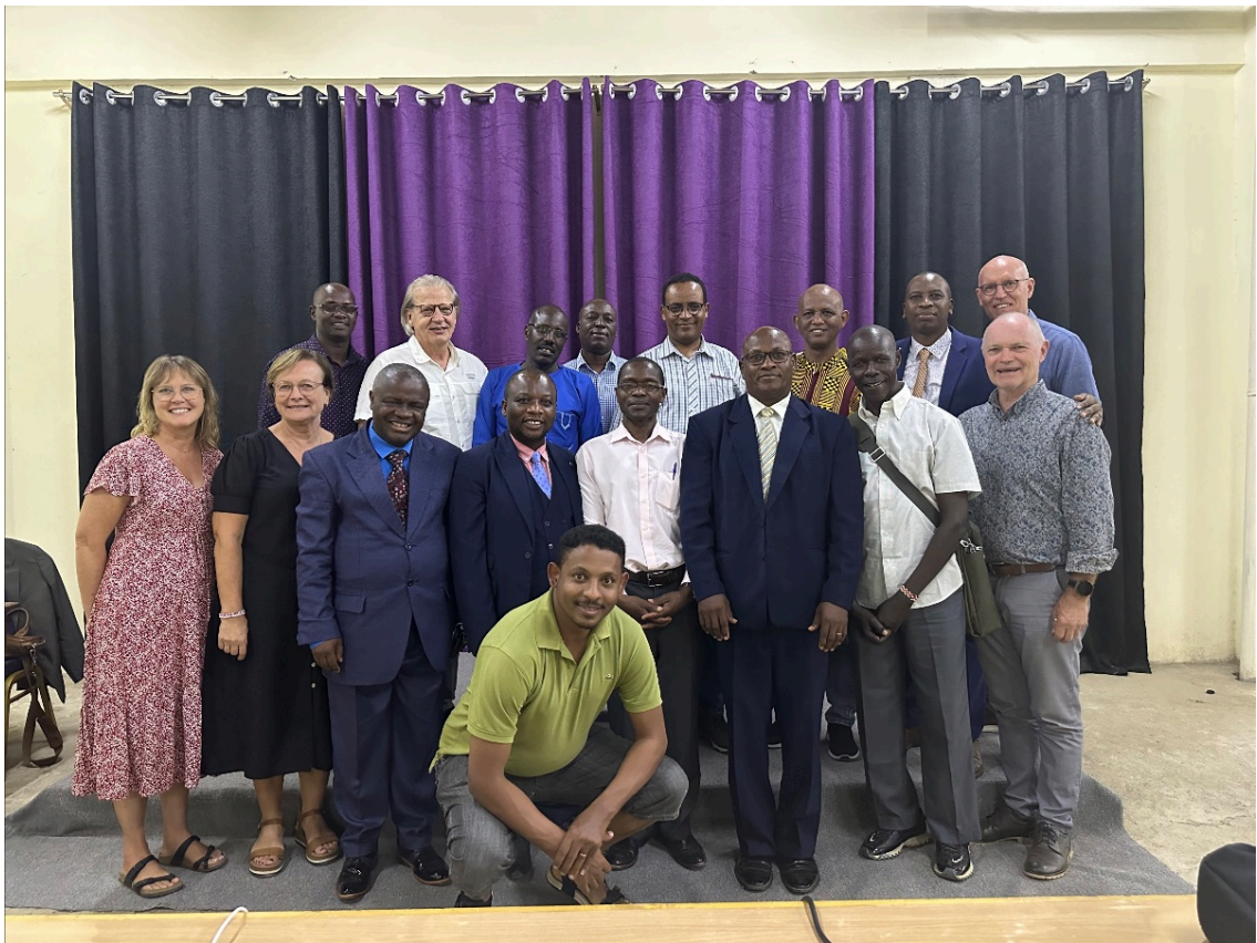
Missionsledare från 8 länder samt Hubbteamet