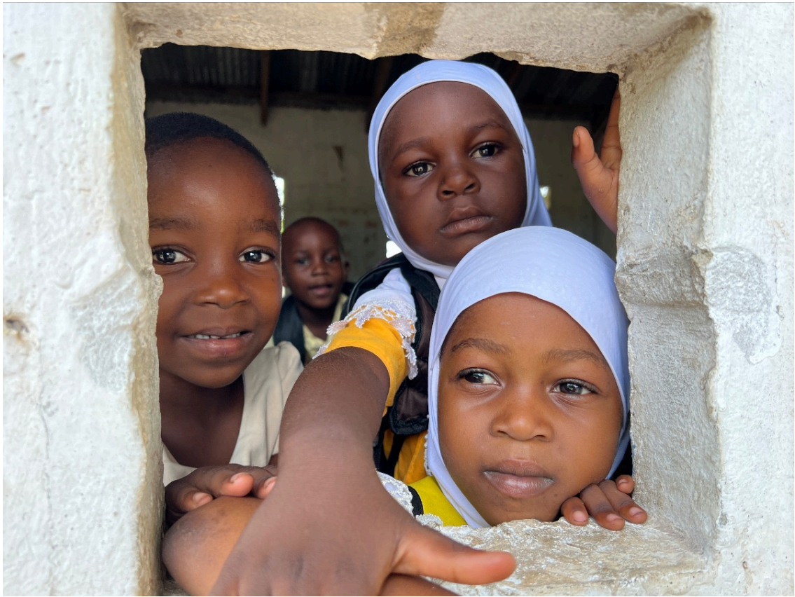
Förskolebarn i Pangani